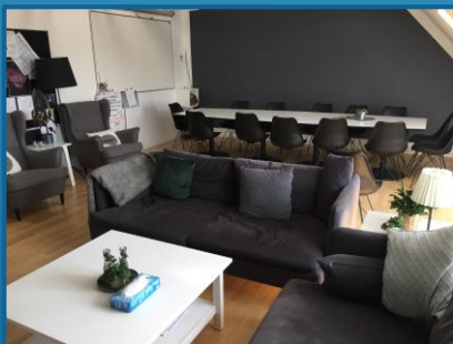
Social gruppe & Terapigruppe