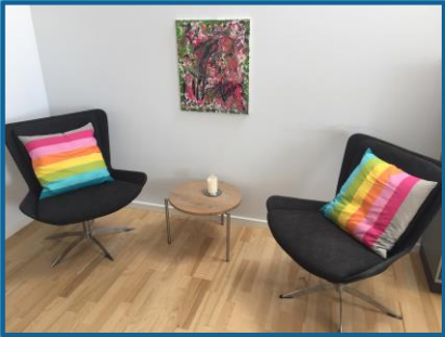
Individuelt tilrettelagt samtaleforløb