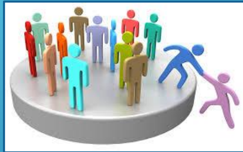
Netværksinddragelse – personligt og professionelt netværk